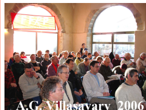
A.C. Villasavary 2006

S'inscrire avant le 25 février au Tél. 04 68 47 69 26