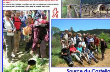
Source du Castellàs