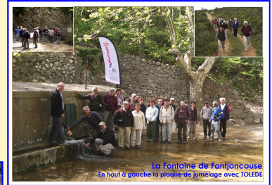
La Fontaine de Fontjoncause En haut à gauche la photo de jumelage avec TOLEDO