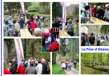
La Prise d'Alzeau