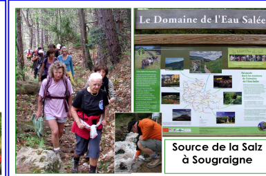
Le Domaine de l'Eau Salée