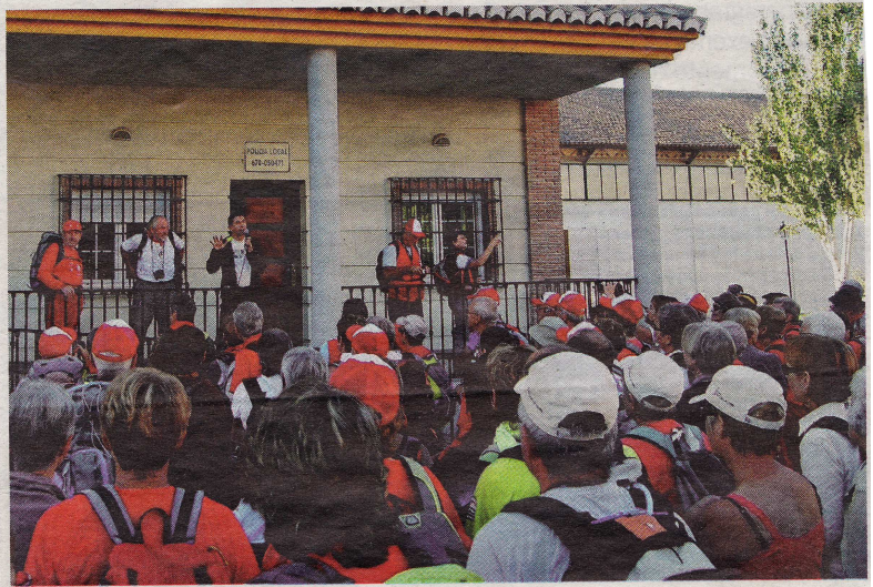
El alcalde de El Padul da la bienvenida a los participantes franceses que llegaron ayer. R. V.