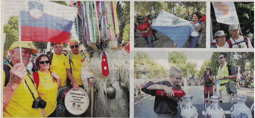
LA FUENTE DE LAS GRANADAS DE LA CAPITAL, PUNTO FINAL DEL EURORANDO 2011

Granada capital fue ayer escenario del día grande del Euroorando 2011. Las trece rutas de las Granadas, en el Paseo del Salón. Los miles de senderistas procedentes de todo el mundo vieron en ánforas el agua 'traída' de sus países para simbolizar la unión de los diferentes pueblos y la fuente de vida que es el líquido elemento. Las vasijas fueron posteriormente trasladadas al pilar del Palacio de Carlos V. El acto concluyó con un desfile urbano con banderas, entre las que se pudieron ver la de la Sociedad Sierra Nevada. Dentro del Euroorando 2011 se han recorrido, durante tres días, un total de 23 senderos con la presencia de más de 3.000 caminantes.