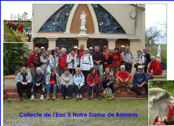
Collecte de l'Eau à Notre Dame de Bassens