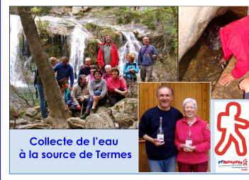
Collecte de l'eau à la source de Termes