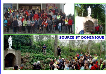
SOURCE ST DOMINIQUE