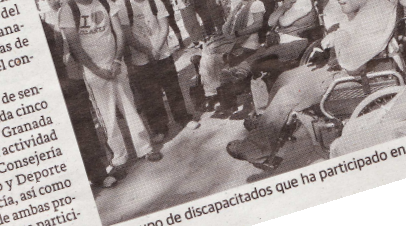
Un grupo de discapacitados que ha participado en el evento. R. V.

La programación de rutas senderistas que hoy abarca un total de tres, mientras que mañana llegará el punto final del evento, con la ceremonia de hermanamiento de los Doce Caminos y Aguas de Europa, en la Fuente de las Granadas, tras efectuarse los once senderos previstos para la jornada final.