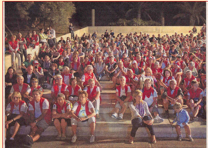
Senderistas anoche en la gran fiesta de apertura del Euroorando, en la Plaza del Mar de El Toyo.