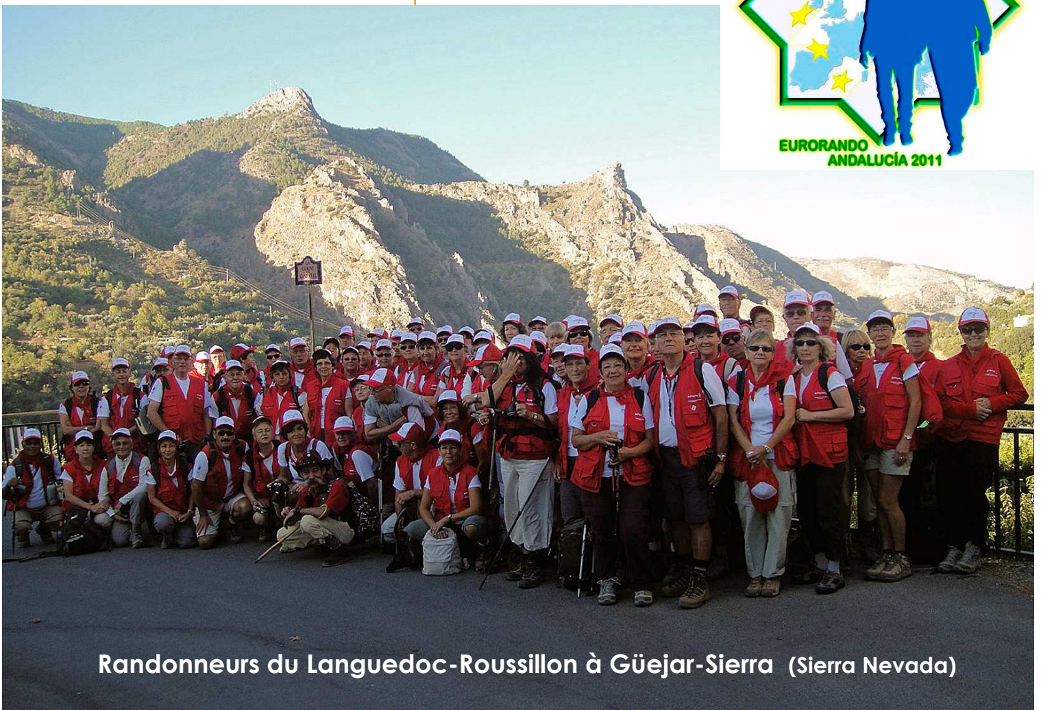
Randonneurs du Languedoc-Roussillon à Güejar-Sierra (Sierra Nevada)