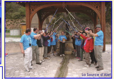
La Source d'Alet